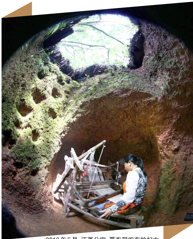
2016年5月,江西分宜,夏布洞织布的妇女。