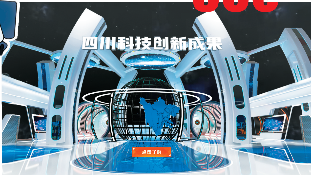
“云展馆”内的四川科技创新成果展示截图。