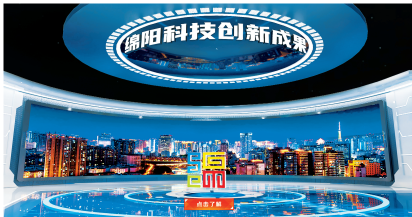
“云展馆”内的绵阳科技创新成果展示截图。

本届科博会提供了数据排行和分析报告。与上午11时发布的榜单对比,截至下午5时的榜单排行发生了哪些变化?