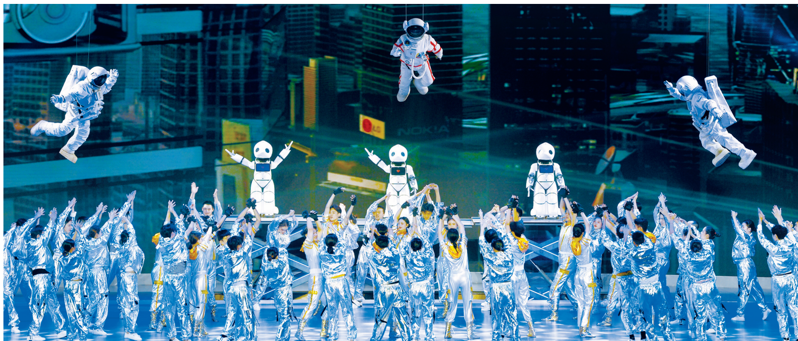
“科技之光”——开幕式展演。