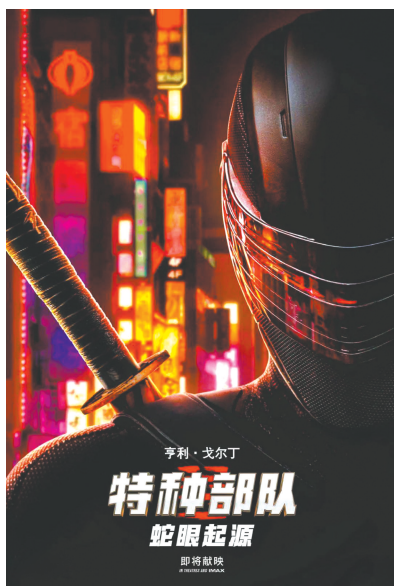
《特种部队:蛇眼起源》海报。