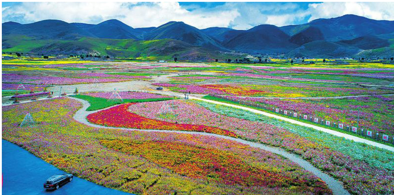
稻城县对八美村2600余亩沙化草场进行改造,建设色拉花海景区,让昔日的沙化草场变身壮美花海。

深秋是许多人眼中最美的季节。随着秋意渐浓,整个稻城亚丁层林尽染。每年,无数游客慕名而来。