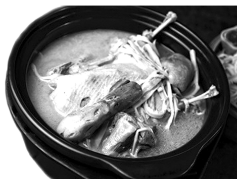
老鸭汤。据都市快报