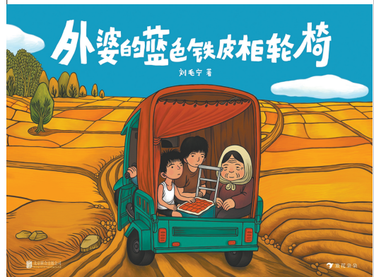
《外婆的蓝色铁皮柜轮椅》