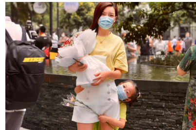
“解封”的居民收到亲人送来的鲜花。