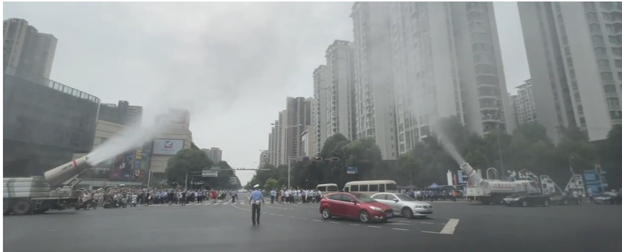
“水门仪式”,庆祝成都高新区石羊街道都城雅颂居“解封”。视频截图

7月28日15时起,成都市青羊区优品道曦岸小区、高新区都城雅颂居小区被划定为中风险地区,区域内居民严格实施居家隔离,足不出户、封闭管理。同时对中风险地区邻近区域实施封控管理,人员只进不出,严禁聚集。在封控区域外缘设置风险管理区,暂停娱乐场所营业,加强居民健康监测。