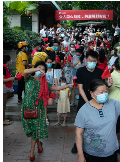
居民载歌载舞走出优品道曦岸小区。