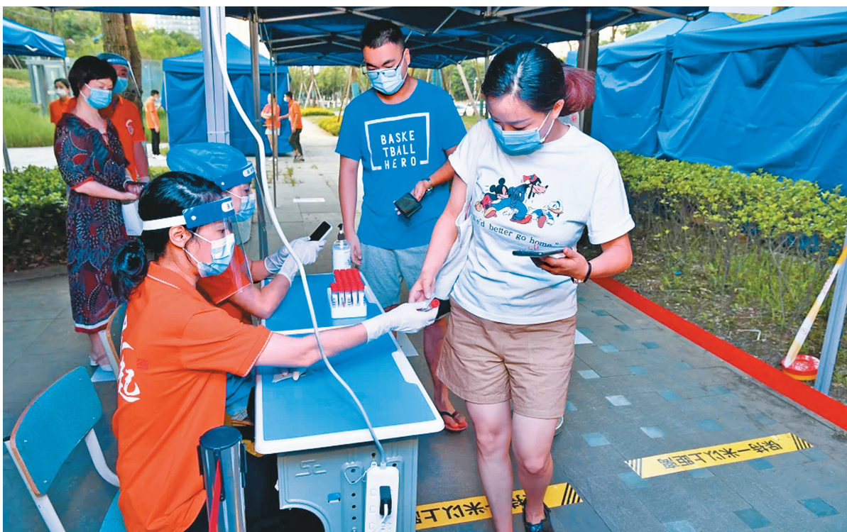
市民有序领取采样试管,进行核酸检测。

●据了解,疫情防控工作进入常态化后,成都市共组建了6465支社区应急响应队伍,分设人员排查、秩序维护、服务管理、环境维护、应急支援、物资保障等6个工作组,确保紧急情况下社区有力量、防控跟得上。