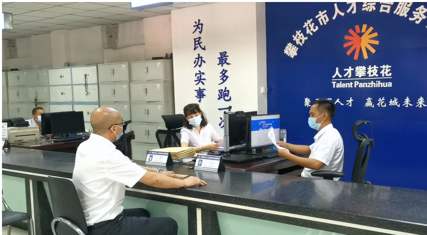
四川机电职业技术学院招生就业处负责人办理引进人力资源奖补申请。

该负责人认为，《措施》的颁布，不仅操作性强，同时对引进外部人才，留住本地人才，实现攀枝花的人才强基战略意义重大。“对提升攀枝花的人才吸引力和城市吸引力，对本地大中专院校的招生就业工作，都有着良好的促进作用。”