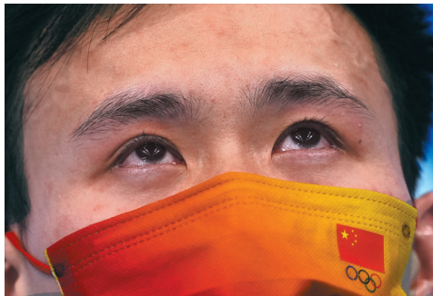
8月3日，谢思埸在颁奖仪式上眼含热泪。

继半决赛逆转战胜队友王宗源排名第一后，谢思埸在3日下午的决赛中，再次以总分558.75胜出，从而完成了包揽东京奥运会跳水男子3米板单人两金的壮举，王宗源获得亚军，英国选手拉夫尔排名第三。