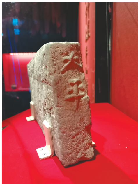
文字砖上的“太平”二字清晰可见。