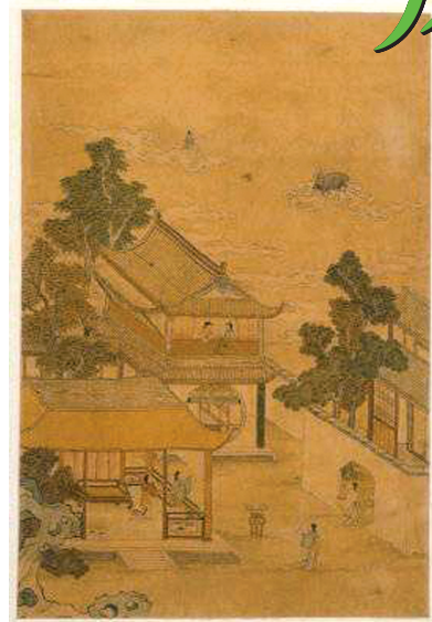
清代《缙丝七夕乞巧图轴》。故宫博物院藏。