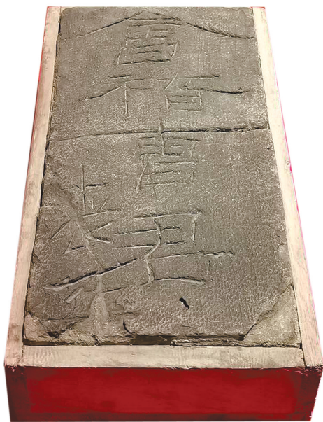
曹操宗族墓出土『会稽曹君丧柩』砖。