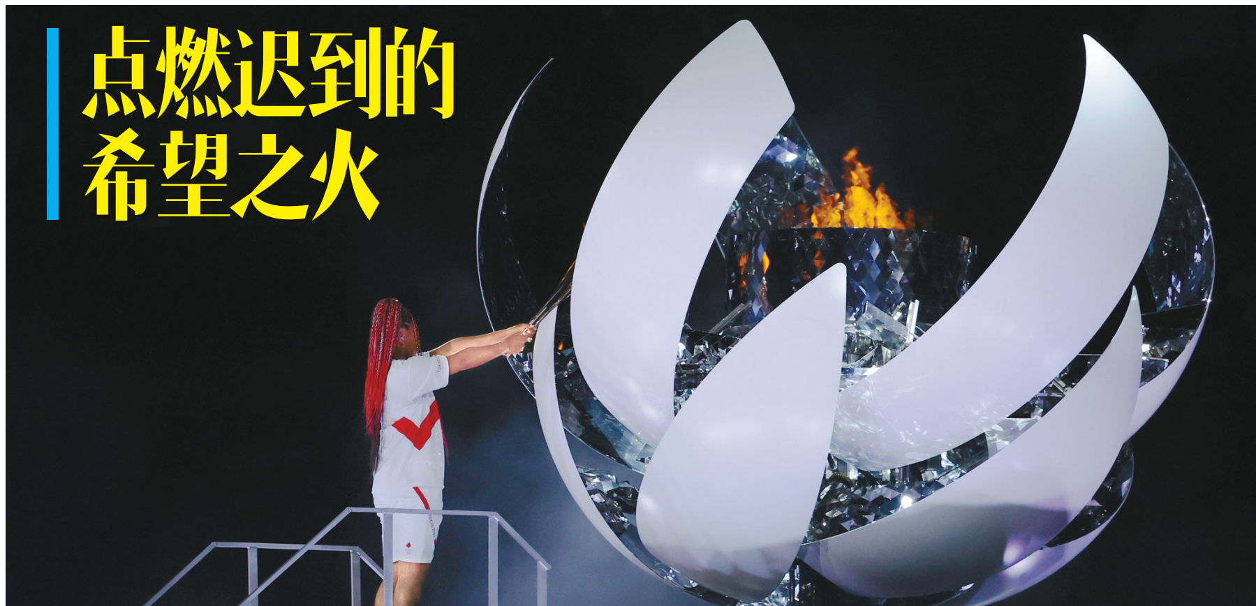
7月23日,日本网球运动员大坂直美在东京奥运会开幕式上点燃主火炬。