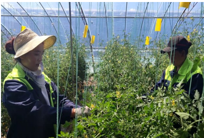
炉霍县村民在飞地产业务工。