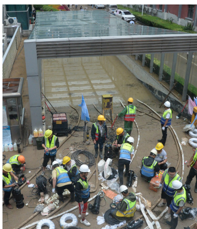
7月21日,救援人员在郑州大学第一附属医院河医院区进行排水抢险。

从7月17日开始,郑州遭遇极端强降雨,三天的降雨量相当于以往一年的降雨量。洪水涌进小区、医院、地铁,许多人被围困,回家路受阻。