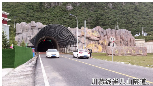
川藏线雀儿山隧道。