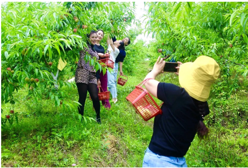
游客在木鱼村采摘桃子。

在王祥与村“两委”干部、驻村工作队队员的共同努力下,木鱼村找到了脱贫路径:旅游扶贫。在大竹县旅游局的对口帮扶下,木鱼村通过完善基础设施、