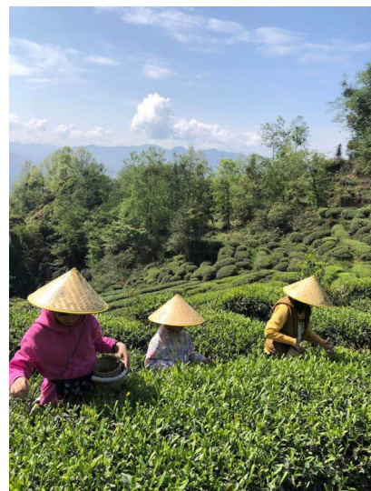
七盘村村民采茶忙。

为什么七盘村的鲜茶叶售价比同类产品高出近20%?郭桂均道出了其中的奥秘:“除了得天独厚的自然条件,也离不开日常的管护。”他说,合作社为农户开展生产技术服务、土壤测土配肥、茶叶销售渠道搭建等,将农资“送到家门”,把技术指导