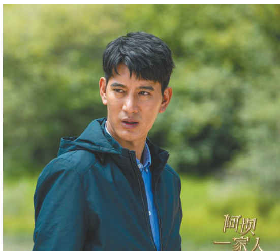
蒲巴甲为《阿坝一家人》倾注心血。