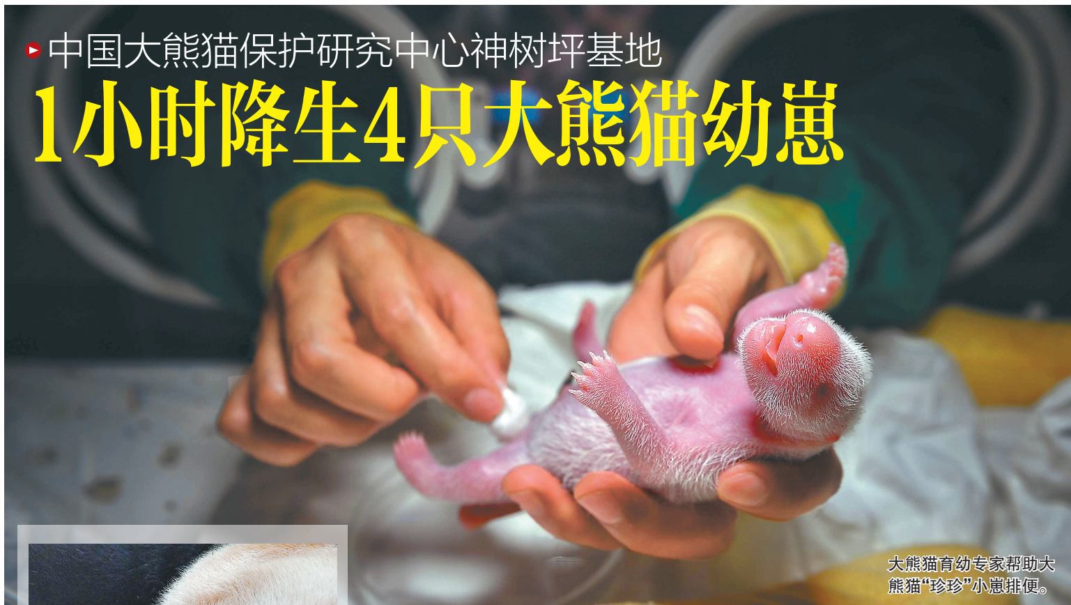
大熊猫育幼专家帮助大熊猫“珍珍”小崽排便。