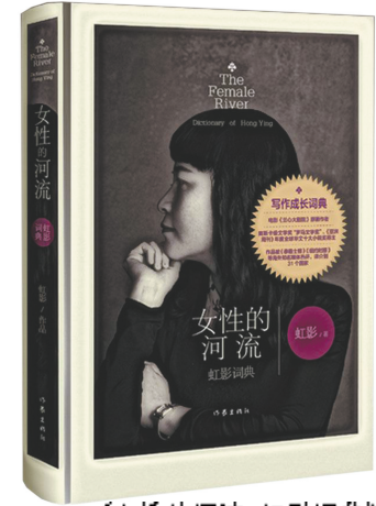
《女性的河流: 虹影词典》