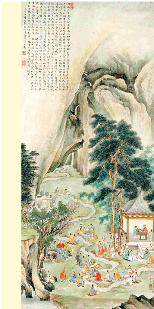
曲水流觞图。溥伉(清)绘

琅琊王氏是历史上有名的文化望族，这个家族无论是庙堂权贵，还是清淡名士，或是书画胜手，都是人才辈出。竹林七贤中的王戎、东晋名臣王导、王敦都出自这个家族。王氏书法最为著名者，当属王羲之、王献之父子，其余以书名世者，有王羲之之祖辈王正、王裁、王基；父辈王廙、王旷、王导、王敦；同辈有王荟、王劭、王洽、王恬；子侄辈有操之、徽之、涣之、凝之、王珣、王珣等；女眷有羲之妻郗璿、凝之妻谢道韞、献之保姆李如意、荀氏、汪氏；后裔还有王僧虔、智永、王著……后裔善书者更不绝于史。南朝史学家沈约说：“自开辟以来，未有爵位蝉联，文才相继如王氏之盛也。”琅琊王氏的优良家风是这个家族人才辈出的重要原因之一。