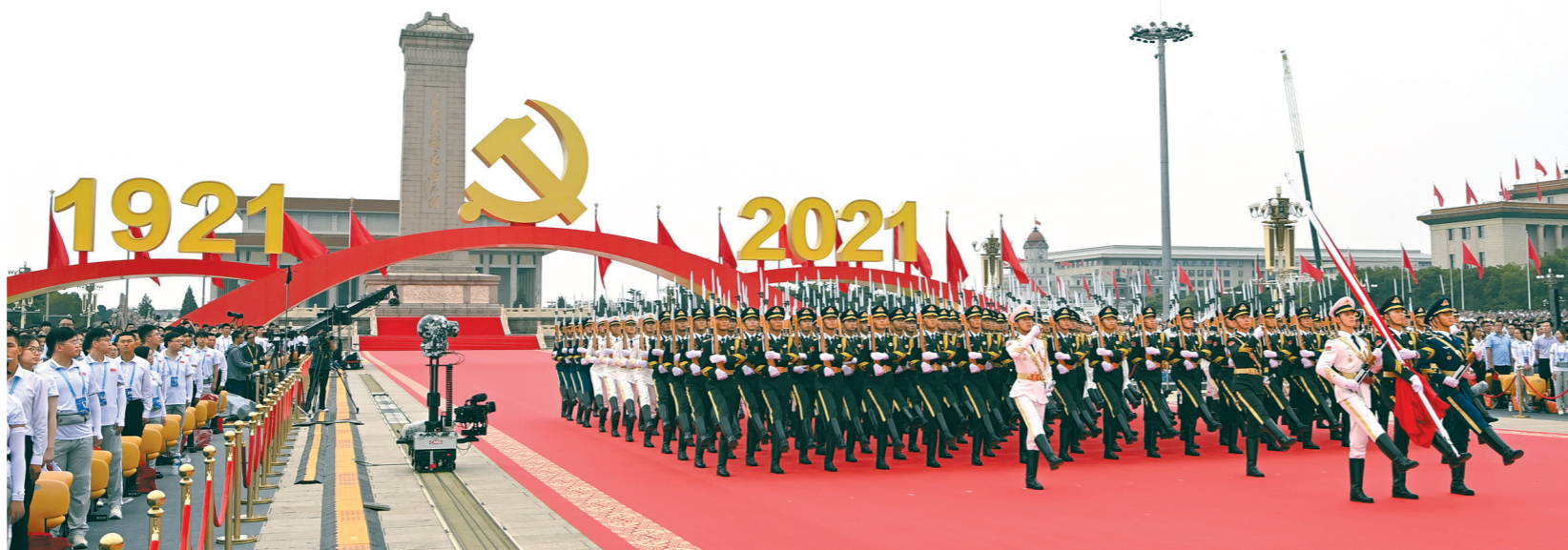
7月1日上午,庆祝中国共产党成立100周年大会在北京天安门广场隆重举行。这是国旗护卫队准备升旗。

历经百年奋斗,承载伟大梦想的航船,如今驶入“实现中华民族伟大复兴进入了不可逆转的历史