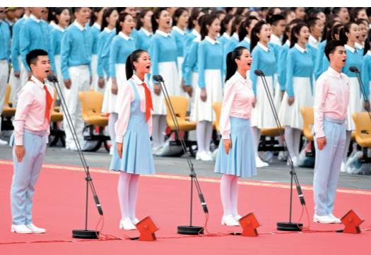
共青团员和少先队员代表集体致献词。

习近平表示,人民是历史的创造者,是真正的英雄。我代表党中央,向全国广大工人、农民、知识分子,向各民主党派和无党派人士、各人民团体、各界爱国人士,向人民解放军指战员、武警部队官兵、公安干警和消防救援队伍指战员,向全体社会主义劳动者,向统一战线广大成员致以崇高的敬意。向香港特别行政区同胞、澳门特别行政区同胞和台湾同胞以及广大侨胞致以诚挚的问候。向一切同中国人民友好相处、关心和支持中