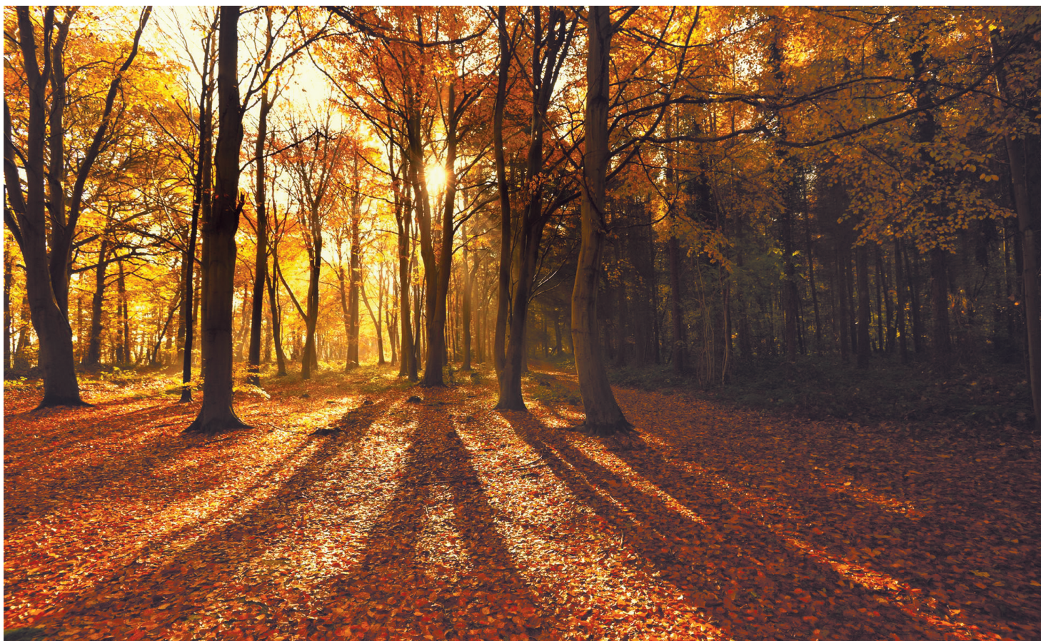
五马归槽林场，阳光洒在林间。