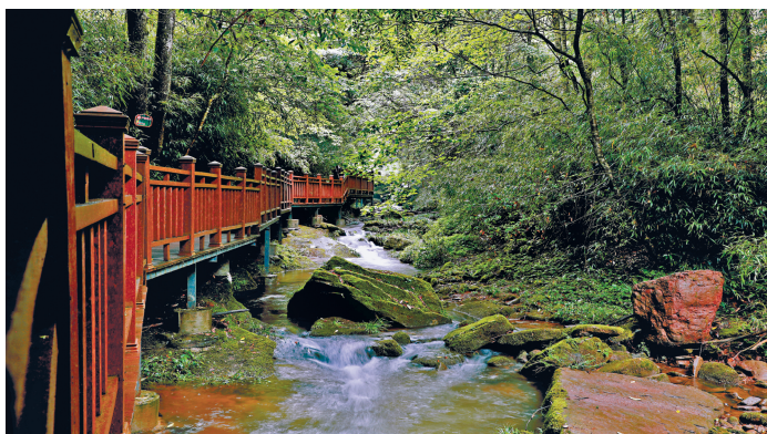
五马归槽林场内溪流瀑布。

这样一块大自然的处女地，何以今日才走进人们的视野？据了解，五马归槽国有林场始建于1957年12月，其成立之初承载着为国家供应木材的职责。在60多年的发展历程中，先后经历了初期创业、伐木生存、转型