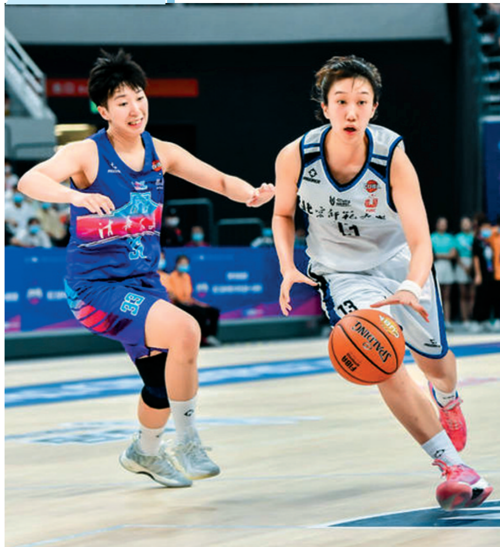
“相约幸福成都”系列赛事。