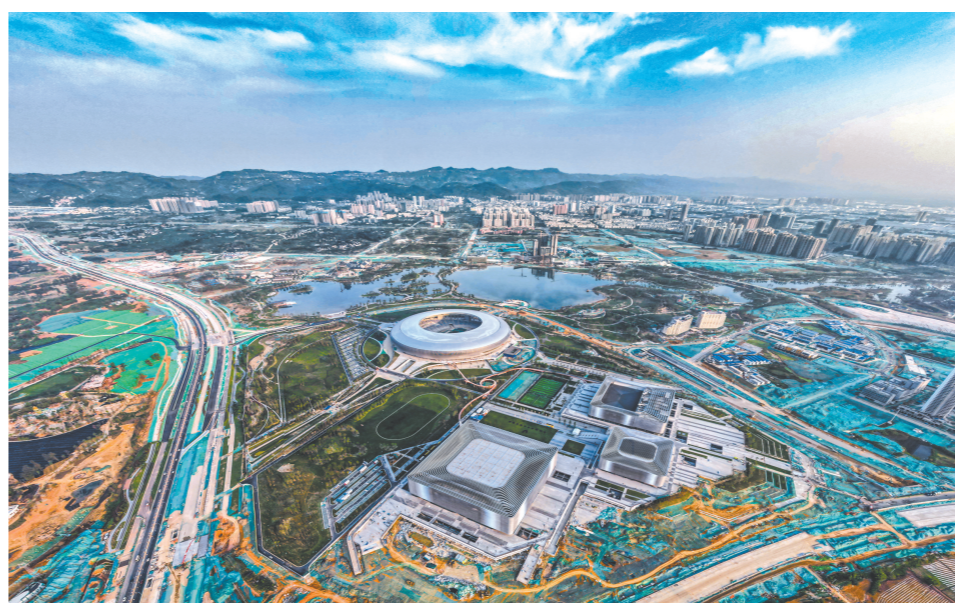
成都东安湖体育公园。

为“道路交通出行惠民”“公园城市景观惠民”“大运社区宜居惠民”“绿色低碳环保惠民”等方面。