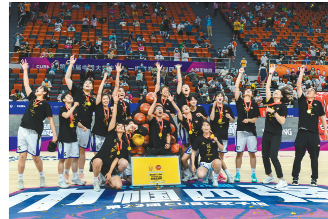
「相约幸福成都」系列赛事。