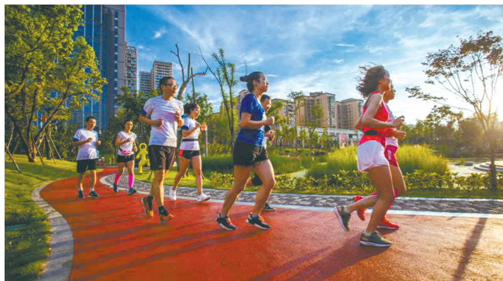
成都跑团在公园中跑步锻炼。