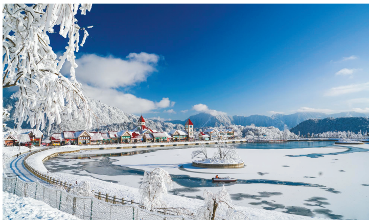
西岭雪山致力打造世界级冰雪旅游胜地。

其实，一生钟情成都的诗圣杜甫写过不少遥望雪山的诗句，“练练峰上雪，纤纤云表霓”“雪岭界天白，锦城曛日黄”“暮倚高楼对雪峰，僧来不语自鸣钟”……雪峰与云霓点缀在城市的西端，千年后的成都，奇景依然。