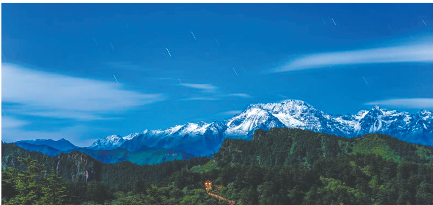
承载“千秋雪”美誉的西岭雪山。