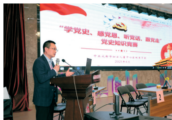
医院党委开展党史知识竞赛。

现全市孕产妇新冠病毒零感染,全院医护人员零感染;世卫组织、国家、省市区相关部门来院调研督查,均给予了高度肯定。