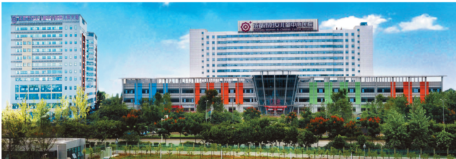
成都市妇女儿童中心医院