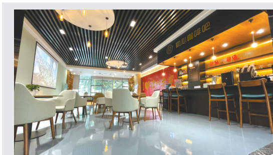
党群服务中心咖啡厅。