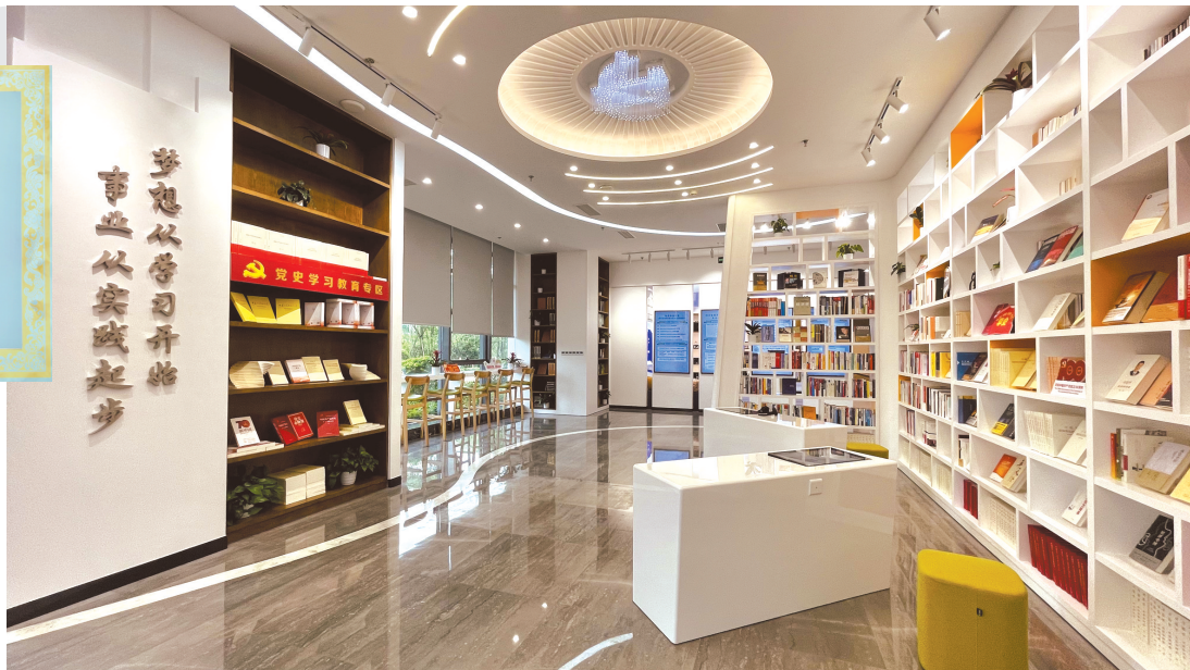
泸州老窖党群服务中心展厅。

随着公司的快速发展，经营体量、业务范围不断增加，泸州老窖按照“应建尽建”原则，让党旗