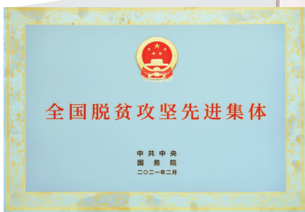
泸州老窖荣获“全国脱贫攻坚先进集体”称号。