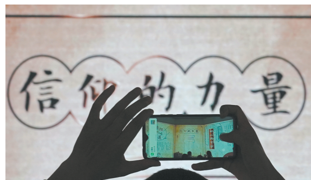
6月19日，观众在中共一大纪念馆参观拍照。

1949年10月1日，站在天安门城楼上，目睹中华人民共和国诞生的中共“一大”代表只剩毛泽东和董必武。