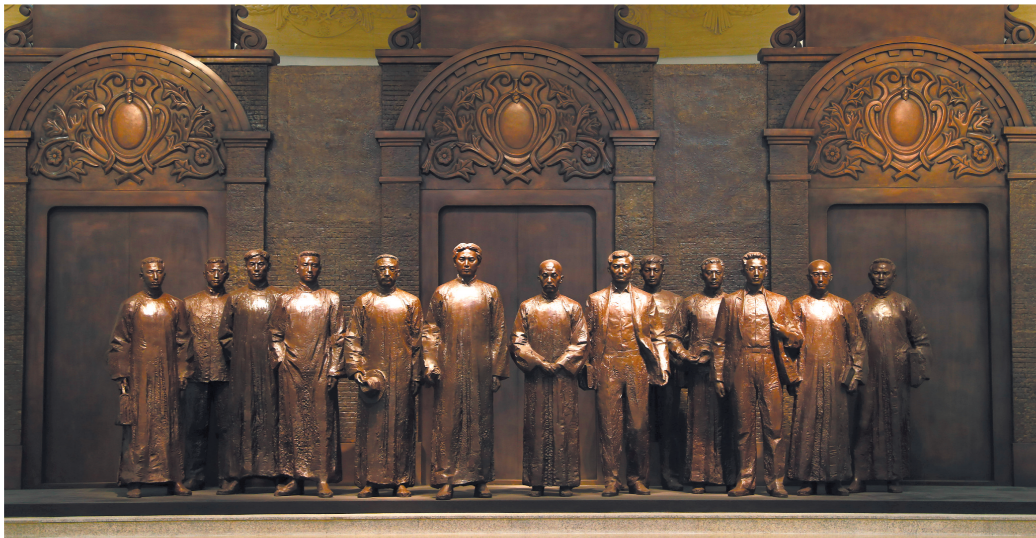
6月1日拍摄的中共一大纪念馆内的一大代表群体铜像。

——2005年，时任浙江省委书记的习近平发表《弘扬“红船精神”走在时代前列》的文章