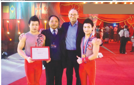
◀遂宁市杂技团的节目受到国际友人喜爱。

城市巡回演出外,还先后应邀赴法国、美国、德国、罗马尼亚、挪威、韩国、泰国、瑞士、俄罗斯、印度尼西亚、日本、新加坡、印度、摩纳哥、英国、马来西亚等国家和地区演出,深受赞誉,为增进各国人民的友好情谊和文化交流作出了积极贡献。