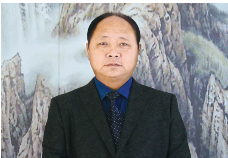
◀中国杂技协会副主席、四川省杂技协会主席童飞。