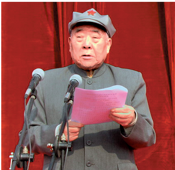
▶王定烈将军生前资料图。