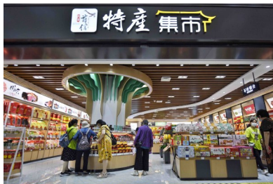
旅客在T2航站楼内的特产集市选购商品。新华社发