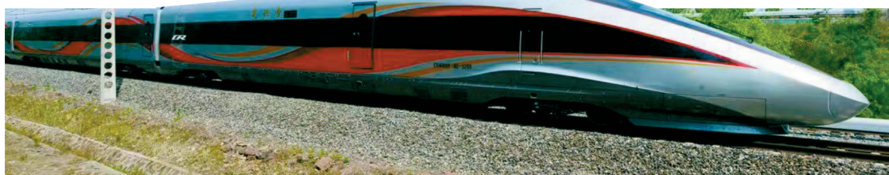
扩大开行使用的复兴号智能动车组包括CR400AF和CR400BF两个型号产品。

记者22日从中国国家铁路集团有限公司了解到,6月25日,伴随全国铁路第三季度列车运行图的实施,复兴号智能动车组将集中上线运行,扩大开行范围,覆盖18个省级行政区。