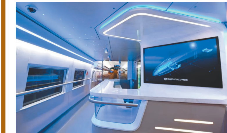
列车内部更加智能。