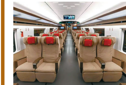
车厢内部更加智能。