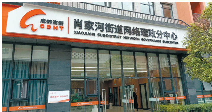
成都高新区肖家河街道网络理政分中心已正式启动，实现了“与民在线、与民同行、与民同心”的7×24小时在线服务。