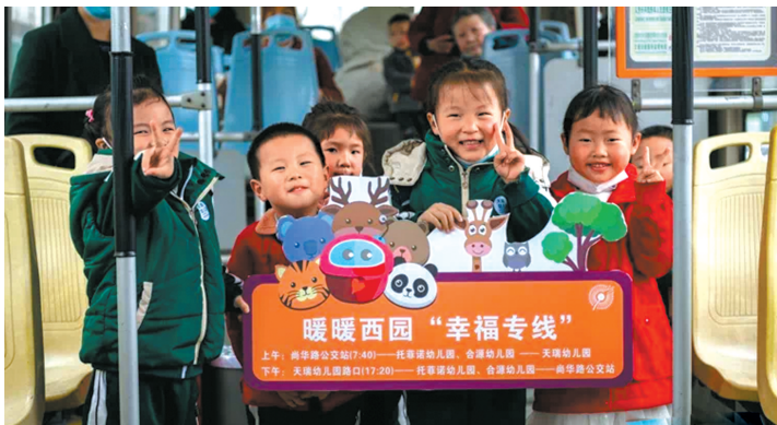
2020年9月，一条从尚锦到天瑞的暖暖西园“幸福专线”开始运行，专线每天早晚各一班，专程接送在天瑞幼儿园上学的孩子们。