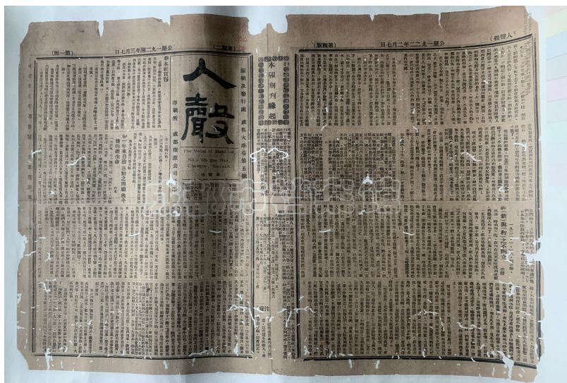
抗战期间出版的《人声》报。成都市档案馆藏

即将推出的“庆祝建党100周年”系列展览,还将呈现新中国成立后的成都迎接崭新时代的蓬勃面貌。成都人如何迅速建立政权、稳定秩序、恢复生产,城市旧日的沉沉暮气如何一扫而光,都可以在此次展览上找到答案。