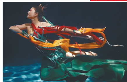
舞蹈《祈》演绎水下飞天。