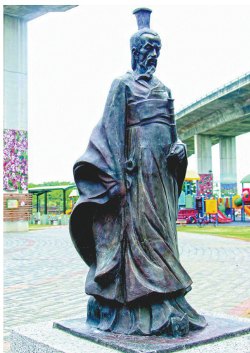
湖北秭归向台湾彰化赠送的屈原雕像。(资料照片)

屈原汨罗江上的纵身一跃,从此“一跃冲向万里涛”,一个“被发行吟泽畔”的形象便永久保留在每个中国人的脑海里。只要有华人在的地方,都是他生命长存的见证。“屈原惟自杀故,越发不死!”