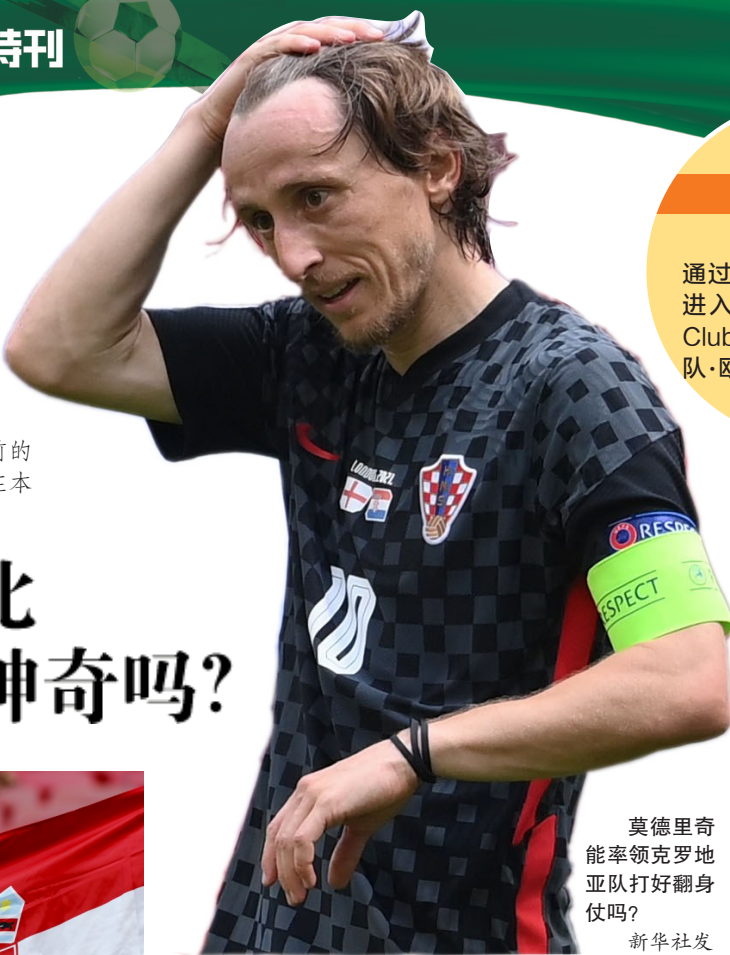
莫德里奇能率领克罗地亚队打好翻身仗吗？