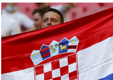
6月13日，一名克罗地亚队球迷开赛前为球队加油助威。

纵观世界杯、欧洲杯等足坛盛事，开局不利但结局良好甚至完美的例子并不鲜见：2010年世界杯，西班牙小组赛首场一球负于瑞士，但最终历史