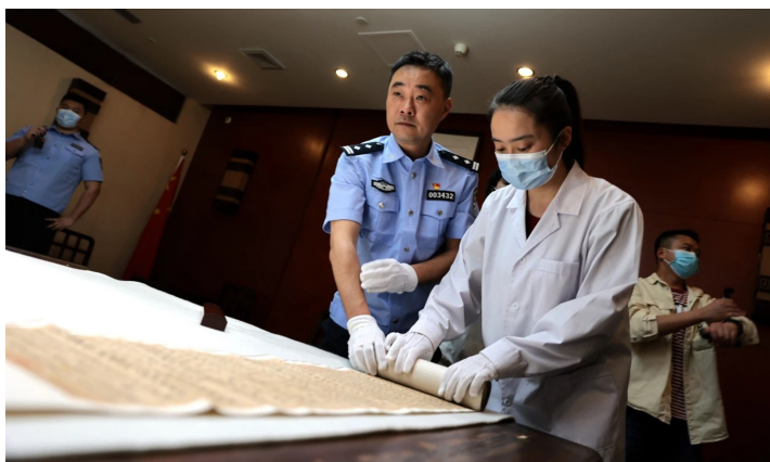
工作人员展示被盗唐代佛经。

2004年12月13日,四川省图书馆管理古籍的工作人员来到书库六楼时突然发现,书库铁锁遭到破坏,一只装古籍的木盒被随意丢弃一旁,盒内的唐代佛经《金光明最胜王经坚牢地神品第十八》的经卷不知去向。失窃的这一卷唐代手