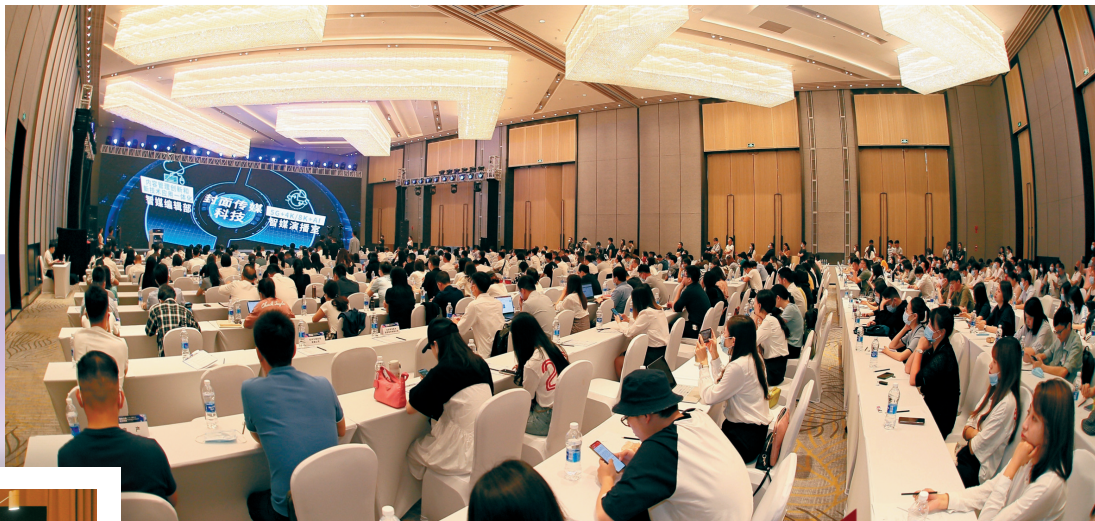
封面传媒科技启航C战略,嘉宾认真观看视频。

四川封面传媒科技有限责任公司由封面传媒联合中国互联网投资基金、四川文化产业股权投资基金共同出资,致力于构建“科技+传媒+文化”生态体,身跨领域、跨行业的数字时代“科创新物种”。