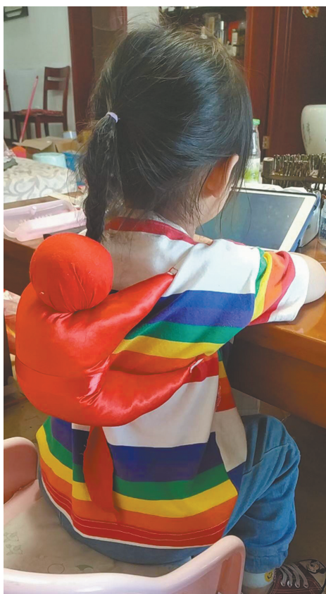
背“香猴儿”驱邪避瘟。