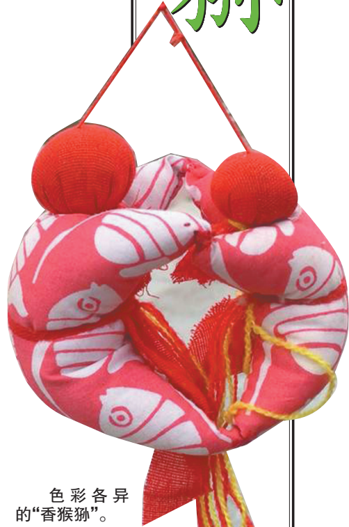
色彩各异的“香猴儿”。