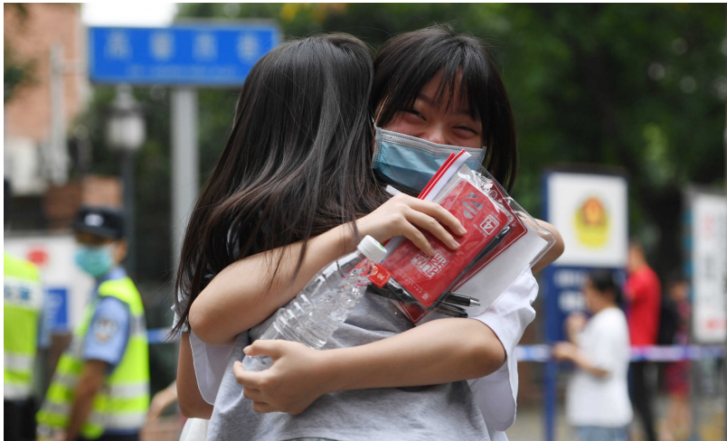
考试结束，成都十二中科华校区考点，两名考生开心地拥抱在一起。