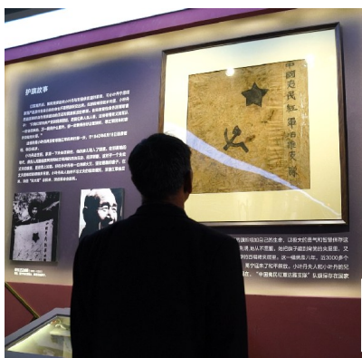
“中国夷民红军沽鸡支队”队旗仿件,原件存于国家军事博物馆。