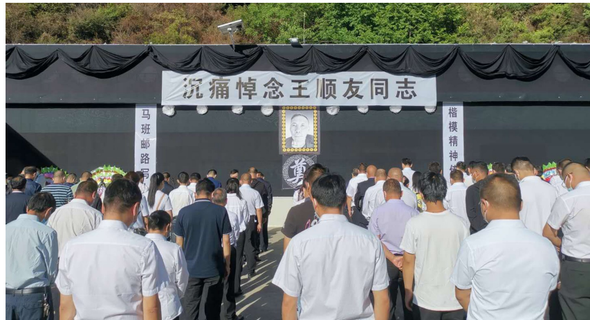
6月1日上午,王顺友告别仪式在木里县举行。

王顺友用一个人的长征,传邮万里。他曾说:“乡亲们需要我,我也离不开他们。”他在平凡的岗位上,践行着“为人民服务不算苦,再苦再累都幸福”的人生信条,32年如一日,把党和政府的声音传递到基层一线。他的一生体现了“马班邮路”信使坚守岗位、服务人民、淡泊名利、默默奉献的优秀品质。