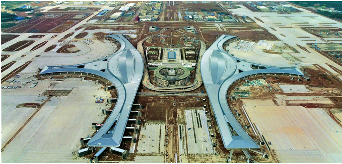
“神鸟”即将展翅翱翔。(资料图)