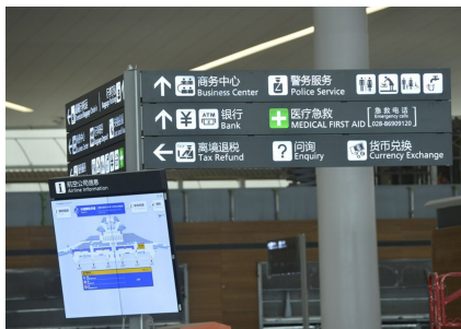
这是3月30日拍摄的航站楼内指示牌。

祥鹏航空涉及成都天府国际机场的航班有成都-昆明、成都-海口、成都-三亚、成都-拉萨等。旅客可以开始购买6