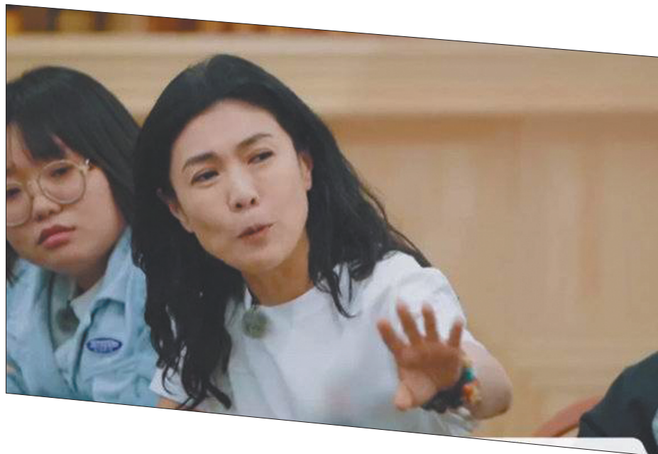
苏芒说“一天650元伙食费不够”在网络上引发巨大争议。