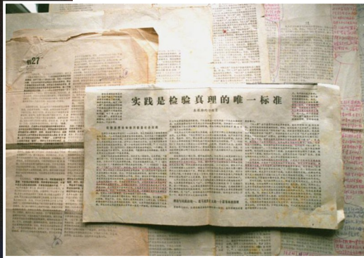
▲这是刊有《实践是检验真理的唯一标准》文章的《光明日报》和修改过的清样。