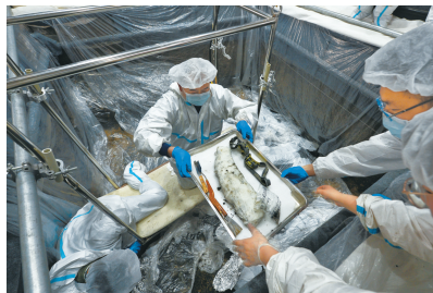
考古人员取出一枚象牙。