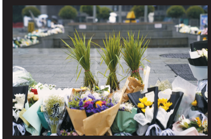
群众送来水稻缅怀袁老。