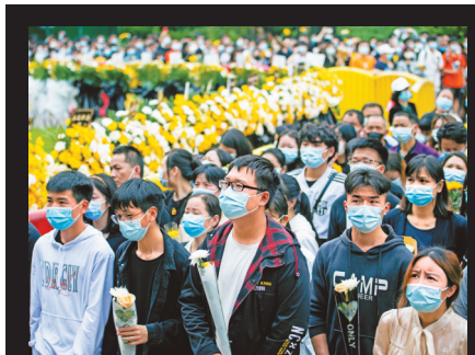
长沙市民前往明阳山殡仪馆送别袁隆平。

告别仪式后，袁隆平同志家属以书面形式致答谢辞。答谢辞说：“2021年5月22日，我们敬爱的父亲带着造福世界的梦想和对杂交水稻事业的无限依恋，不幸与世长辞了。他的去世，让我们感到万分悲痛。今天，各位领导、各位亲朋好友在百忙之中前来参加家父的追悼会，在此，我谨代表家属对各位的到来表示衷心的感谢！”对于群众自发悼念袁隆平，答谢辞中特别提到：“家父去世后，社会各界自发组织悼念活动，我们切实感受到了大家对父亲的敬重与爱戴，在此表示衷心的感谢。家父在湖南农科院、湖南杂交水稻研究中心及安江农校工作期间，单位领导及同事也给予了默默的付出和倾力支持，使得父亲能够全身心地投身于杂交水稻的研究工作中，在此向他们表示深深的感谢。”